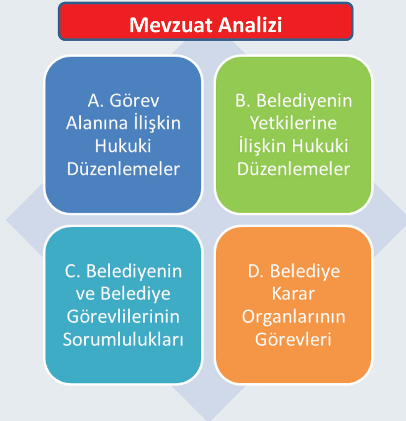
Şekil 1: Mevzuat Analizi

Bunun nedeni, belediye kanunları ile görev alanı, yetkileri ve sorumlu oldukları tespit edilmiş, 5018 sayılı Kanun ile de gelir ve gider süreci, mali işlemlerde görev alanlar ve bunların mali sorumlulukları ortaya konulmuştur.